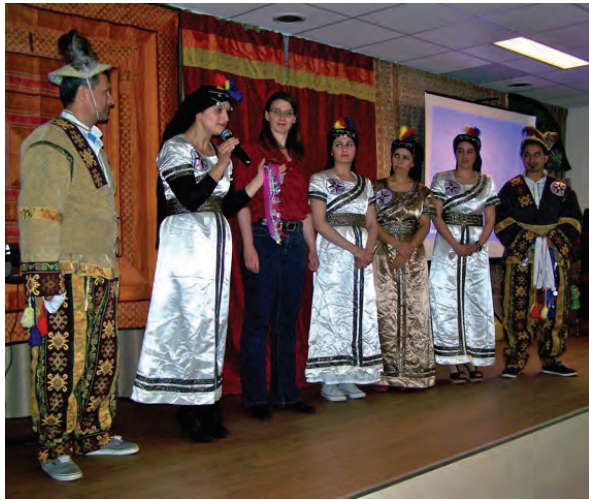
Assyrische dans tijdens de Syrië benefietdag

In juni organiseerden we een aantal activiteiten voor humanitaire steun aan Syrië. We hielden een huis- aan-huiscollecte, we zamelden goederen in en organiseerden een benefietdag. Opbrengsten waren voor het Syrische Comité Nederland, een vrijwilligersorganisatie die humanitaire steun verleent aan oorlogsslachtoffers en vluchtelingen in en rondom Syrië.