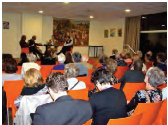
Podiumgesprek over Verlieservaringen